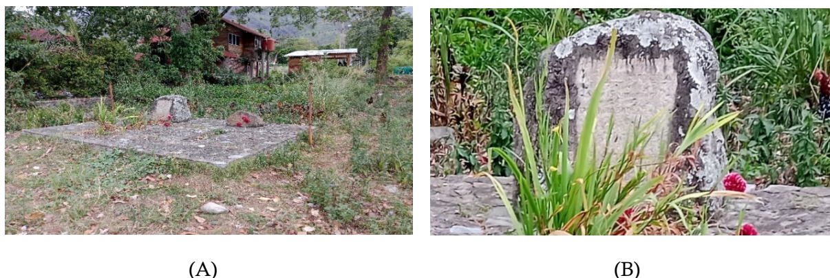
Gambar 7. (A) Makam SS di Samping Makam Ibundanya, (B) Tulisan pada Pusara Makam SS Kabur dan Sulit Dibaca

arah menuju makam. Dapat dipastikan bahwa hanya segelintir orang yang tahu keberadaan makam ini.